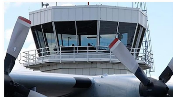
Enligt ett förslag från kommunstyrelsens arbetsutskott ska Skövde flygplats läggas ner för att göras om till industrimark.