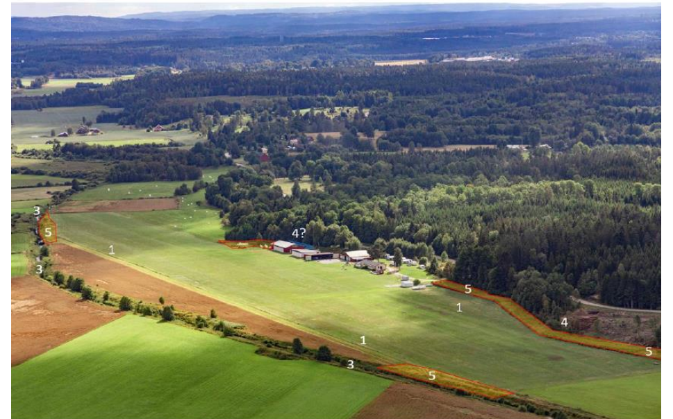
ÖVERSIKTSFOTO, SE HÄNVISNINGAR TILL NUMMER NEDAN.